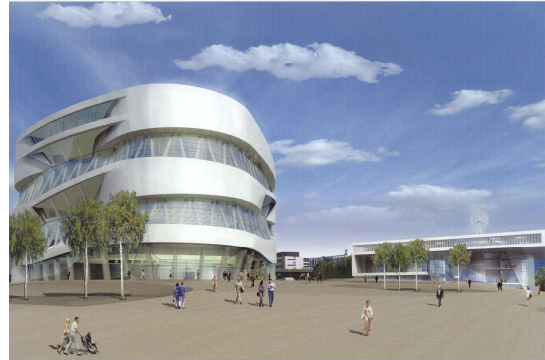
Das Neue Mercedes-Benz Museum Das Mercedes-Benz Center Stuttgart