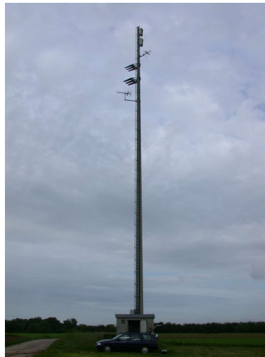
AT Beilstein 41