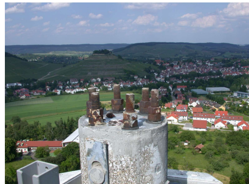
Rostende Schrauben am AT Weinsberg 41