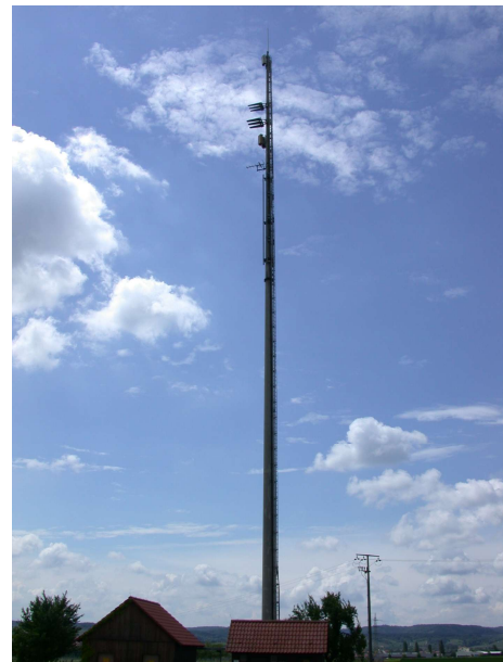
AT Besigheim 42