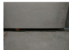
Verloren gegangenes Treppenlager